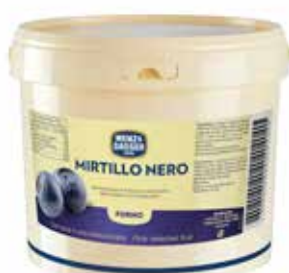
Mirtilli Neri Forno