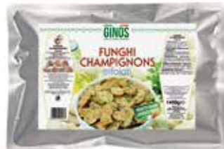
Funghi Champ. Trif. (Busta) GI08107 Kg. 1,45