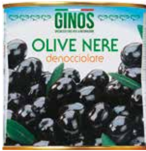
Olive Nere Denocciolate GI01306 Gr. 2500