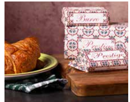
Burro Prestige MEBUR-PRE-1 Kg 1x10