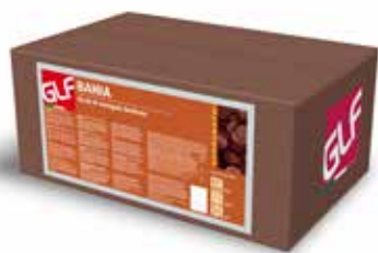
Bahia Dischi Fondente