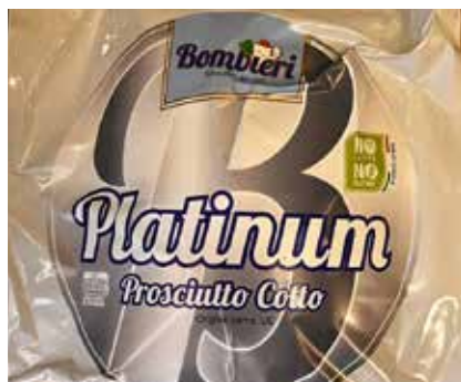
Prosciutto Cotto Platinum Bombieri BOMBIERI12242 7 Kg c.a.