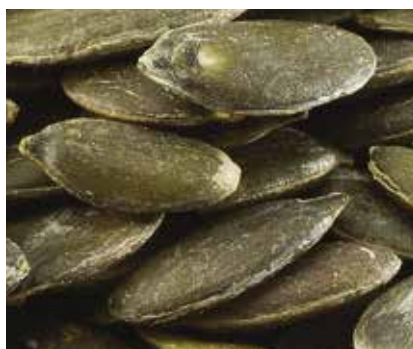
Semi di Zucca