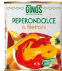
Peperondolce a filetoni (sgoccolato) GI01204 Gr. 510