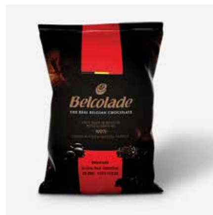
C501-UK20 Grains Noir Selection 20000