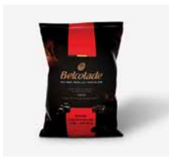
C501UK10 Selection (GRAINS) Gocce Ciocc. (4018288)