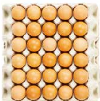
Uova Sfuse Grandi