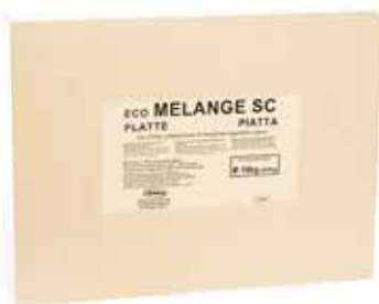
Eco Melange Impasti SN1413408 Kg.2x5