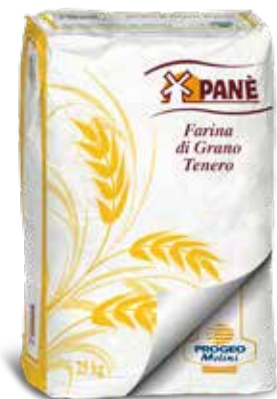
Farina Tipo 00 PERLA W 300-320 PO8001923001595 Kg. 25