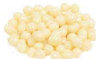
Palline Di Cereali Cioccolato Bianco