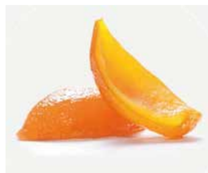
Scorze Arancia Quarti CC02901 Kg.5