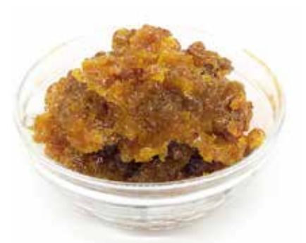
Pasta Scorzone D'Arancia Sup. Navel