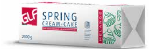
Spring Cream-Cake Kg.2,5 IFSDMOOCP Kg.2,5x4