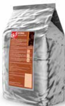
Vittoria Dischi Surrogato Fondente