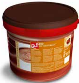
Gran Tradizione Nocciola IFSDC00AX Kg.13 secchio grande