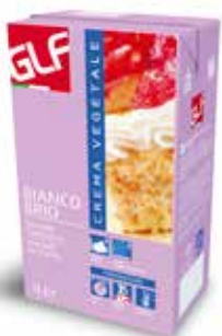
Bianco Brio IFSDV00AA Lt. 1