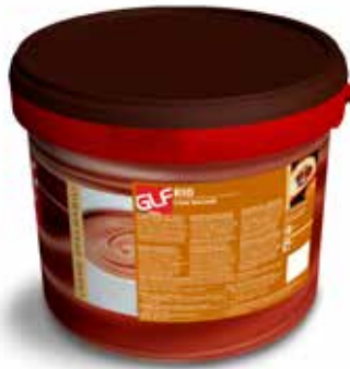
Rio Crem Nocciola IFSDC00BJ Kg.13 secchio grande