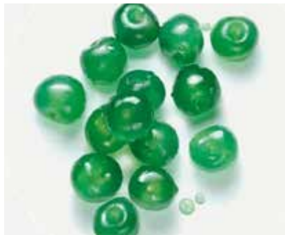
Ciliegie Candite Verdi cal.20/22 CC00030 Kg. 5