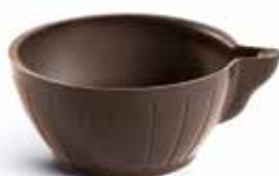
Tazzine da Caffè in Cioccolato