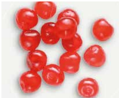
Ciliegie Candite Rosse cal.20/22 CC00029 Kg. 5