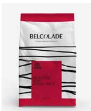
C501J NOIR Selection cop. ciocc. fondente 55