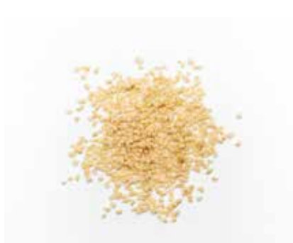
Granella Mandorle Pelate