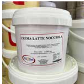
Crema Pistacchio 20 LOREFFPC7482 Kg.5 secchio piccolo