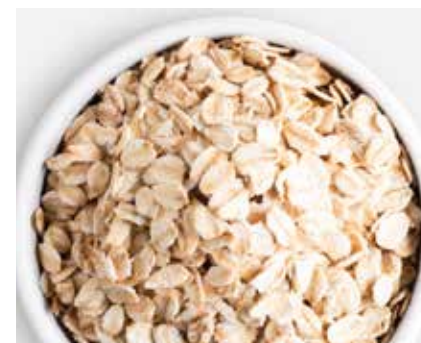
Fiocchi di Avena