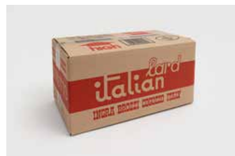
Strutto Rosso INBRS012PV010 Kg.12,5