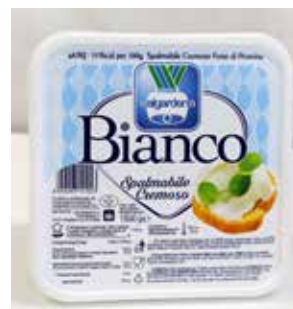
Formaggio Spalmabile VG559 Kg. 1,5