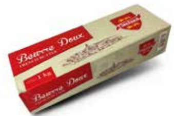
Burro Flecharde 82% Lingotto SN1745340 Kg.7 x70