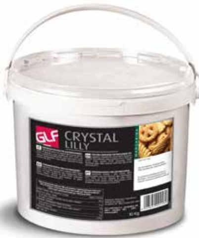
Crystal Lilly IFSDMOOAR Kg 10