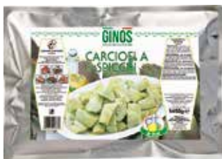
Carciofi Spicchi Olio (Busta) GI01333 Kg. 1,45