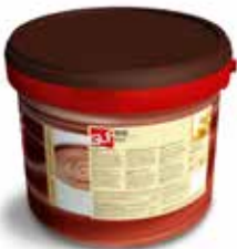
Rio Blanc (crema farcitura) IFSDC00BE Kg.5 secchio piccolo