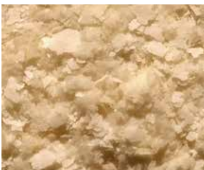
Fiocchi di Patate