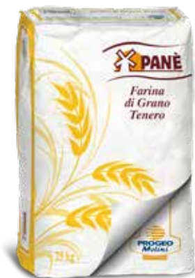
Farina Tipo 00 GEMMA W 180-200 PO1301025 Kg. 25