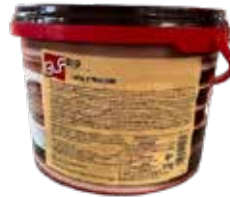
Rio Latte Nocciole IFSDC00CV Kg.5