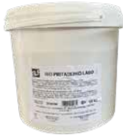
Rio Pistacchio LABO IFSDC00DW Kg.10