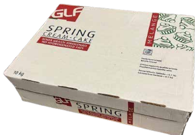
Spring melange Cream-Cake NI IFSDBOOGF Kg.2,5 x Pz.4