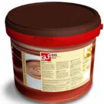
Rio Blanc IFSDC00AC Kg.13 secchio grande