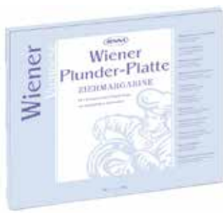
Viennese Plunder Platte SN1413408 Kg.2x5