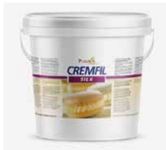
Cremfil Silk Vaniglia PU4020679 Kg.5