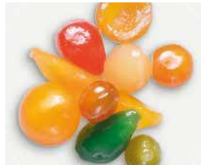
Frutta Assortita CC00206 Kg. 5