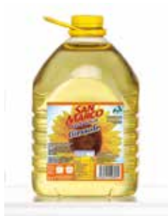
Olio Di Semi Semi di Girasole BUSO017045 PET Lt.5x2 BUSO017045 Alto Oleico PET. Lt.5x2