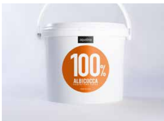
Confettura Albicocca CENTOPERCENTO Castellani