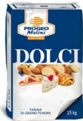
Farina 3 Grazie 00 LIEVITATORE W420 Per dolci PO1309825 Kg. 25