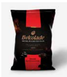
C501-UA Cioccolato Puro Fondente in Cubetti da Cm.1