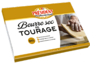
Burro 84%mg. Piatto President BIG030709 Kg.2x5