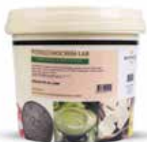
Pistacchio Crem Lab DULXSR252 Kg.12