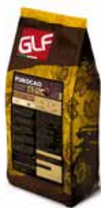
Purocao Fondente 62 39-41