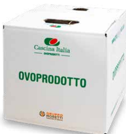
Misto D'Uovo Pastorizzato Refrigerato Super Giallo