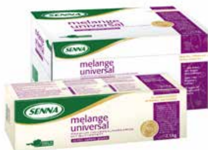
Senna Melange Universal SN1214220 4x25 Kg.