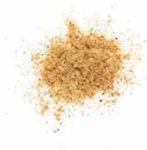
Farina di Nocchie