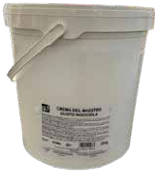
Crema del Maestro Nocciola IFSDC00BQ Kg.20