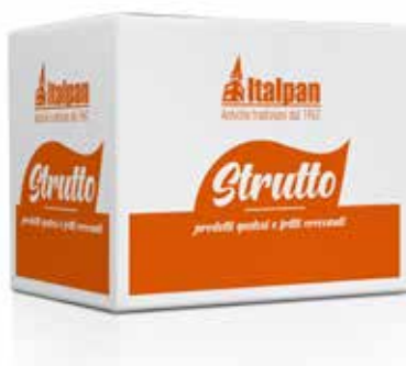
Strutto RPGSTV2 Kg. 25 - Naturale IA0280012 Kg. 25 - Raffinato