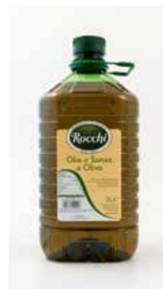
Olio Sansa OLBA Lt.5x2