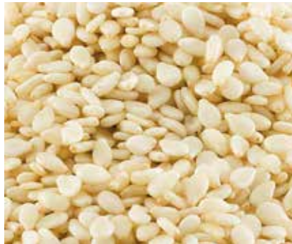
Semi di Sesamo (decorticato)