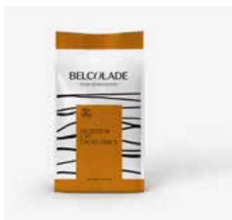
O3X5G Drops Lait Selection