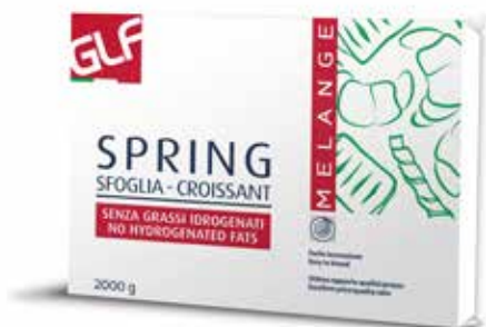
Spring Melange Sfoglia Croissant IFSDBOOGE Kg 2x5