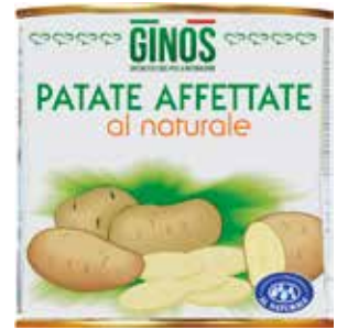
Patate Fette al Naturale GI01336 Gr. 2500