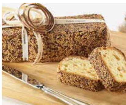
Puravita Deco Multi