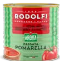
Passata Pomarella Ardita RD111124001 Kg. 3x6 (2650 ml x 6)