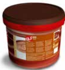
Rio Cacao IFSDC00BW Kg.5 secchio piccolo