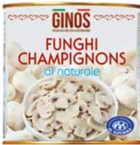
Funghi Champignon GI08101 Gr. 2500