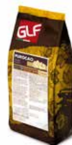
Purocao Chunks Bianco