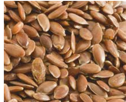
Semi di Lino