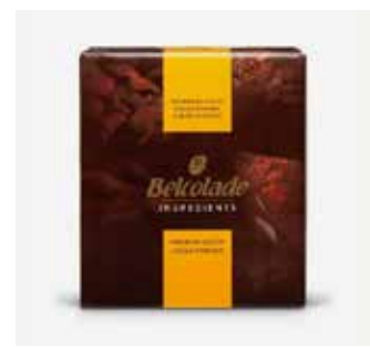
Polvere di Cacao 22-24