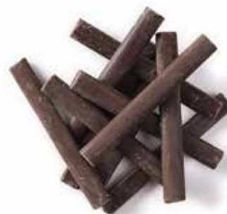
Barrette Sticks Fondente

DULCC185 Dulcistar Kg. 1,6 PU4000564 Belcostick 300 kg.1,6