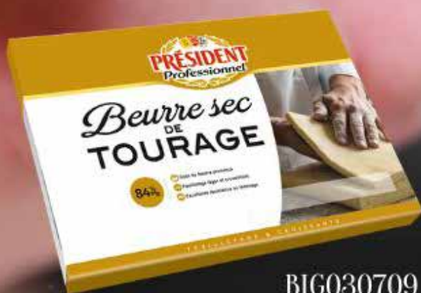
BIG030709 BURRO 84%MG. PIATTO PRESIDENT KG.5X2