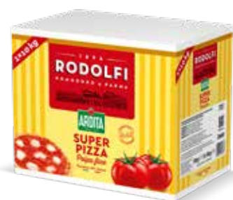
Polpa Super Pizza Ardita Bag Box RD111256002 Kg. 10