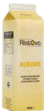
Albume D'Uovo Pastorizzato