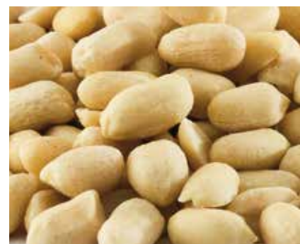
Arachidi Scusgiati Pelati