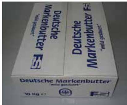
Burro Markenbutter Blocco BLA000510 Kg 10