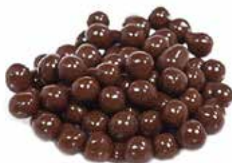
Palline Di Cereali Cioccolato al Latte