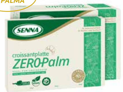
Zeropalm Piatta Croissant SN1413491 Kg.2x5