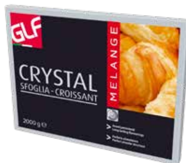
Crystal Melange Sfoglia Croissant SDBOOAA Kg.2x5