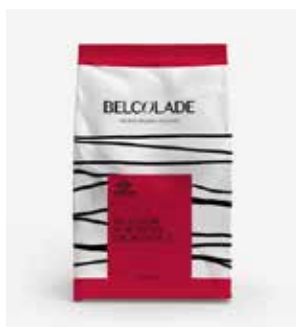
Noir Superior Cop. Fond. 60_ D600 (4016494)