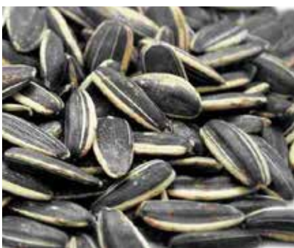
Semi di Girasole