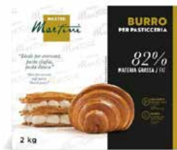
Burro Per Pasticceria Piatto 82% OLDABU5BA Kg.2,5