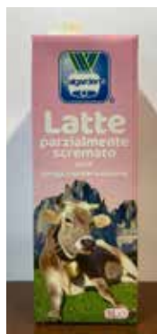
Latte Parzialmente Screm. UHT VG848 Lt. 1x12