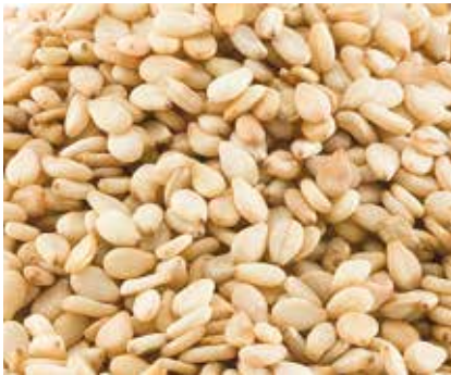
Semi di Sesamo (naturale)