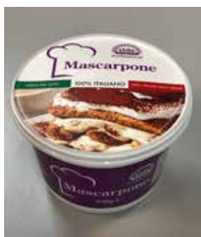
Mascarpone VG299 Gr. 500 Pz. 1