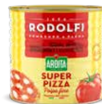
Polpa Super Pizza Ardita Piccola RD111224002 Kg. 3x6