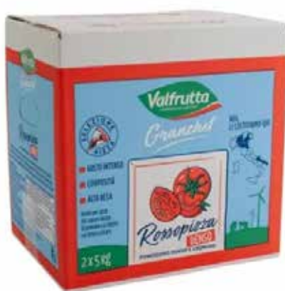
Valfrutta Rossopizza Denso CI0010054700 2 x 5 Kg.