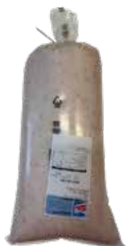
Lardo Macinato SAN MARTINO SSM00156 Kg.5