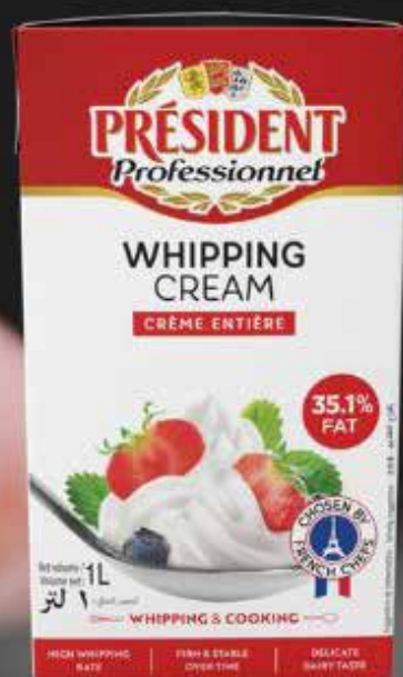
BIG472010 PANNA MONTARE PRESIDENT 35,1% PZ.1