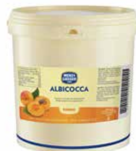
Albicocca 4 Stag.