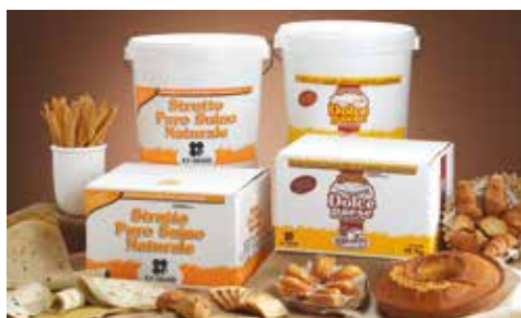
Strutto Naturale RPGSTV2 Kg. 25 RPSECC IN SECCHIO Kg. 25