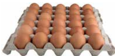
Uova da Allevamento In Gabbie Grandi Sfuse