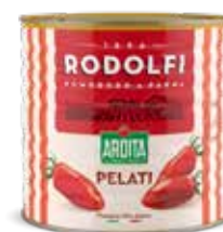
Pomodori Pelati DU010559 Kg. 2,5 x 6