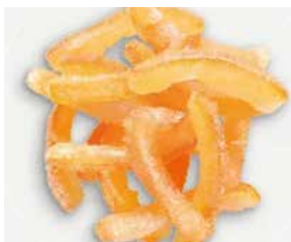
Filetti Arancio CC02100 6x60 - Kg. 5