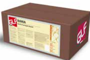
Bahia (Surrogato Bianco) Dischi