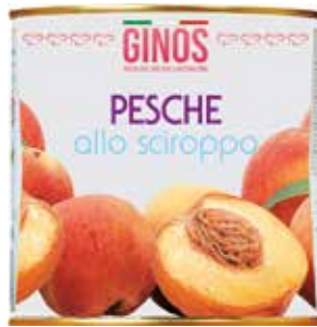
Pesche Sciropate GI09013 Gr. 2550