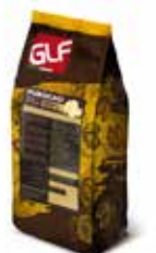
Purocao Burro Cacao