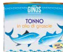
Tonno GI05008 Skip Jack vegetale - gr. 400