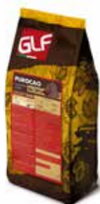
Purocao Latte 36 36-38