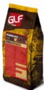
Purocao Chunks Latte