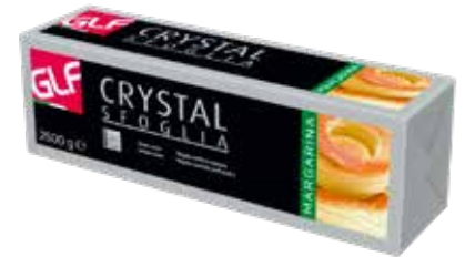
Crystal Sfoglia IFSDM00LA Kg. 2,5x4