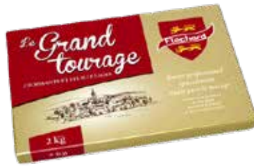
Burro Flecharde 82% Grand Tourage SN1745343 Kg.2x5