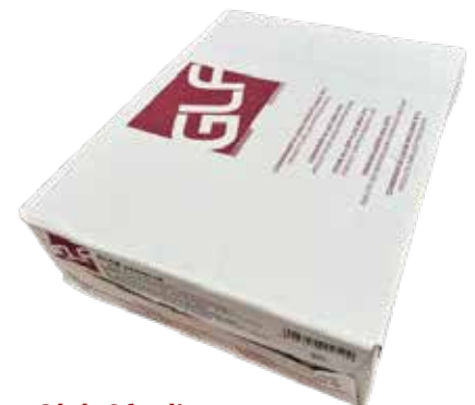
Glob Sfoglia IFSDM00EN Kg.2x5