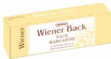
Viennese Back SN1412401 Kg. 2, 5x4