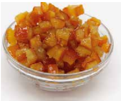
Arancia Cubettata 12X12 Navel