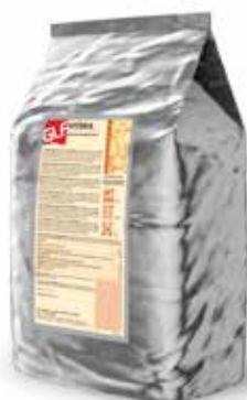
Vittoria Dischi Bianchi