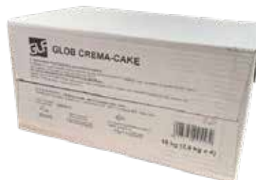
Glob Crema Cake IFSOM00EL Kg.2,5x4