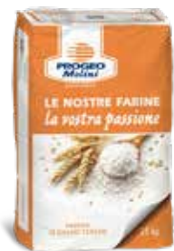
Farina 3 Grazie Riso Per tutte le lavorazioni PO1074010 Kg. 10