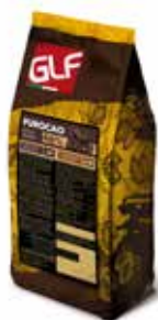
Purocao Gocce Fondenti 1500 46