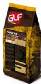
Purocao Fondente 54 32-34