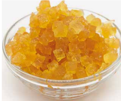
Pera Cubettato Sup.