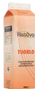
Tuorlo D'Uovo Pastorizzato