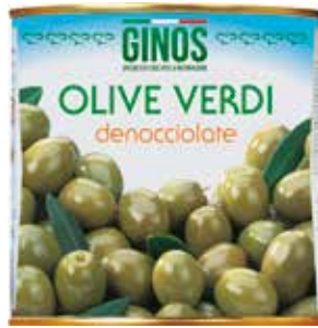
Olive Verdi Denocciolate GI01306 Gr. 2600