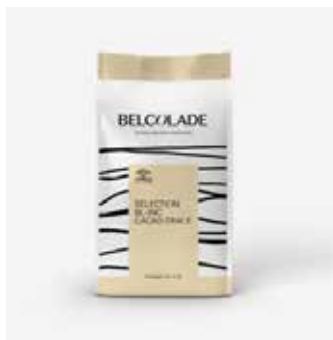
X605G Drops Blanc Selection