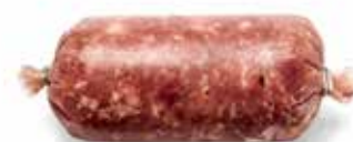
Salsiccia in Manica SM10003 7 Kg c.a.