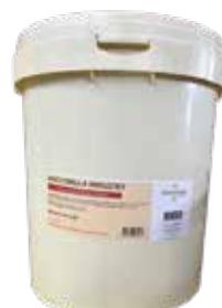
Nocciorella Industry DULSR163 Kg.24