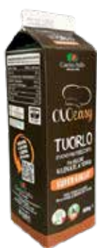
Tuorlo Pastorizzato Super Giallo