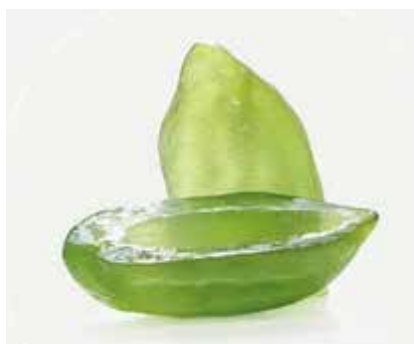
Cedro Coppe Diamante CC801 Kg. 5