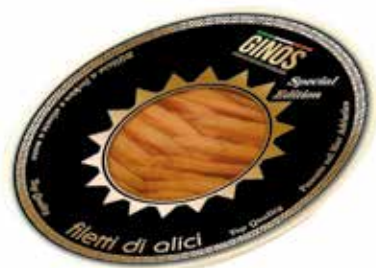
Filetti Alici Italiane in Olio GI05003 gr. 730