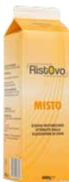
Misto D'Uovo Pastorizzato