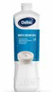
Debic Panna 35% White Cream UHT FRI0740709 Lt. 2