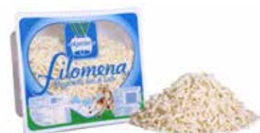
Mozzarella Julienne VG459 Kg. 2,5 VASCA LACON10027 Kg. 2,5 BUSTA