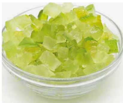
Cedro Cubettato 9x9