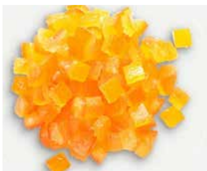
Cubetti Arancio CC01403 6x6 - Kg. 5 CC01413 9x9 - Kg. 5