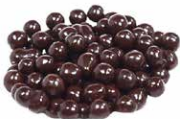
Palline Di Cereali Cioccolato Fondente

DULCC185 Dulcistar Kg. 1,6 PU4000564 Belcostick 300 kg.1,6