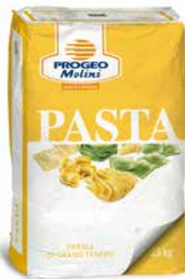
Farina Tipo 00 Gransfoglia Per pasta fresca PO1000000508 Kg. 25