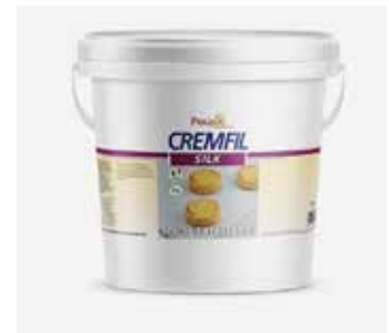
Cremfil Silk Limone Italiano PU4015924 Kg.5