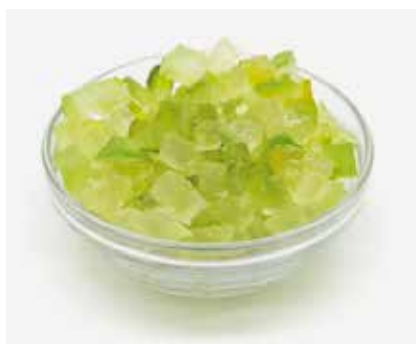
Cubetti Cedro CC00912 6x6 - Kg. 5 CC00914 9x9 - Kg. 5