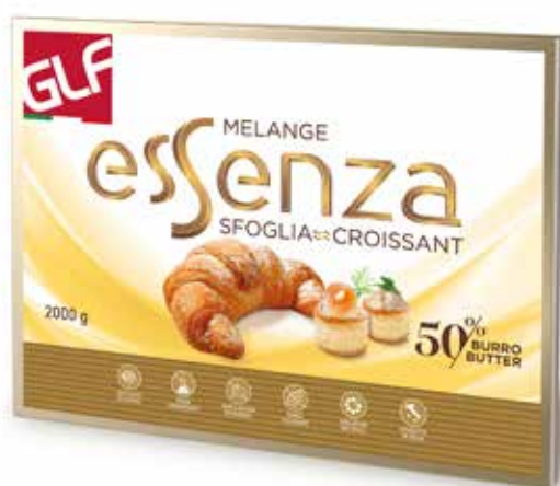
Essenza Melange 50% Sfoglia Croissant IFSDBO0IA Kg.2x5