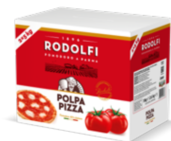
Polpa Pizza Bag Box Ardita RD111256001 Kg. 2x5