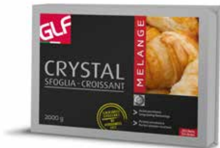
Crystal Melange 25% IFSDBOOHA Kg.2x5