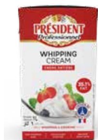
Panna 35,1% President BIG472010 Lt. 1