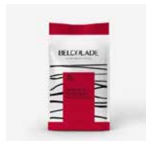
Noir absolu Ebony Drops Massa di Cacao (4014534)