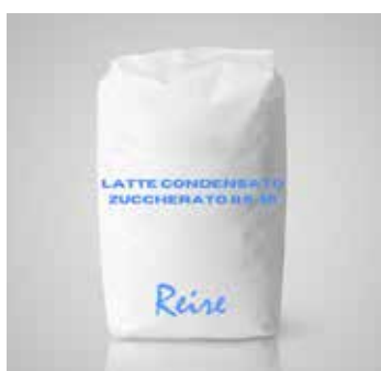
Latte Concentrato Zuccherato 9% REI01011013 Kg. 5