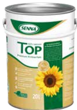
Senna Top SN1222201 Lt. 20