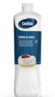
Debic Panna Prima Blanca 38% MG FRI0844254 Lt. 2