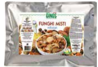
Funghi MISTI Trif. (Busta) GI08037 Kg. 1,45