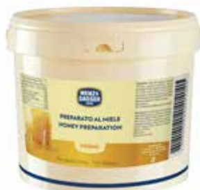
Miele Forno per Farcitura