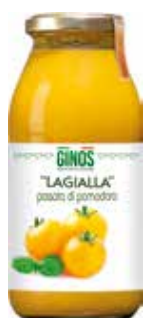
Passata di Pomodoro La Gialla GI04014 Gr.500 Pz.1