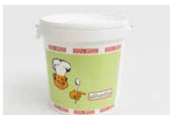
Ulivetta INGRA BROZZI INBRCA012PV150 Kg. 25