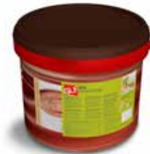
Rio Tradizione Pistacchio IFSDC00BM Kg.5 secchio piccolo