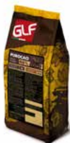
Purocao Gocce Fondenti 46_850-HG