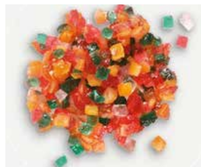
Cubetti Macedonia CC01303 6x6 - Kg. 5