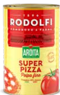
Polpa Super Pizza Ardita Latta RD111225002 Kg. 5x3