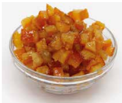
Arancia Cubettata 9X9 Navel