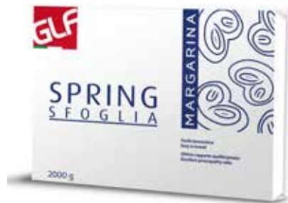
Spring Sfoglia IFSDMOOCE Kg.2x5