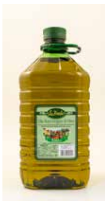
Olio Extra Vergine Di Oliva OLBA Lt.5x2