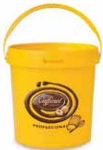
Pasta Bitter Caffarel LINDT043023 Kg.5 secchio piccolo