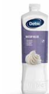
Debic Natop 80/20 FRI1747273 Lt. 2