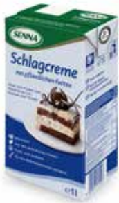
Panna Vegetale SN1246210 Lt. 1