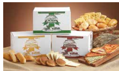
Emulsionato San Mauro RPGESM2 Kg. 25