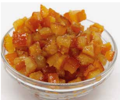
Arancia Candita Cub.12x12