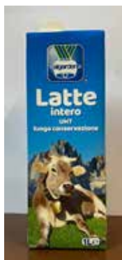
Latte Intero UHT VG848 Lt. 1x12