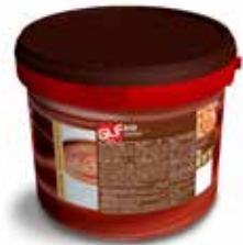
Rio Gianduia (Crema Farcitura) IFSDC00BF Kg.5 secchio piccolo