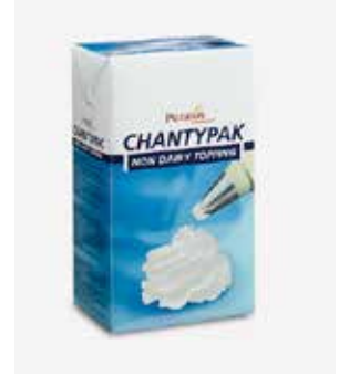
Chantypak PU4108602 Lt. 1