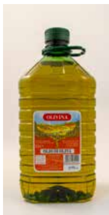
Olio Di Oliva OLBA Lt.5x2