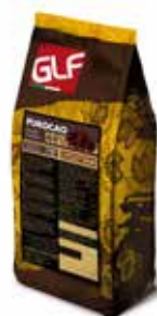
Purocao Chunks Fondente