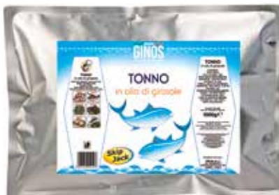
Tonno GI05010 Skip Jack busta olio - gr. 950 sgoc.