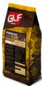
Purocao Fondente 70 39-41