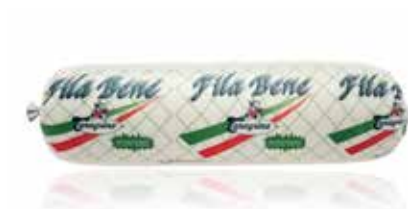
Preparato Alimentare Fila Bene Filone TAPAFB2000FI Kg. 2