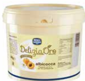
Albicocca Delizia ORO 70%