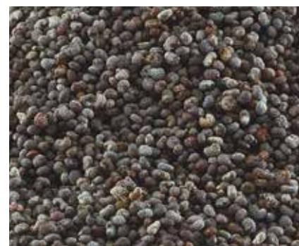
Semi di Papavero