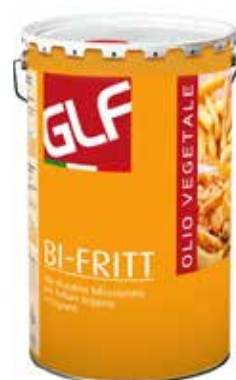
Olio Palma Bi-Fritt IFSDG00CA Lt. 25