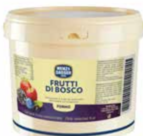
Frutti Bosco Forno